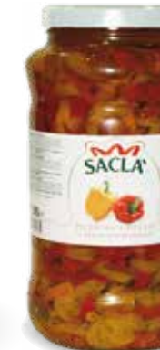
PEPERONI A FILETTI Pepper stripes LCVOM00-004