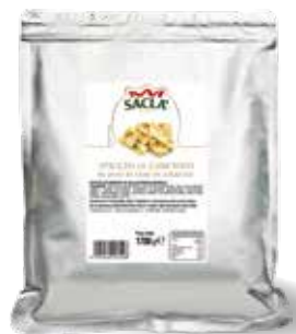
SPICCHI DI CARCIOFO Artichoke quarters LOK11VL000-010