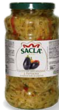
MELANZANE A FILETTI Aubergine stripes LOCV137000-004