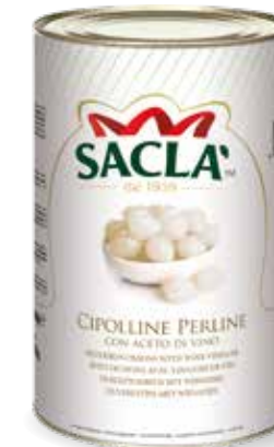
CIPOLLINE PERLINE Silver skin onions L0730UN000-003