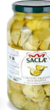
CARCIOFI TAGLIATI ALLA RINFUSA Artichokes cut in pieces LOCV18C000-004