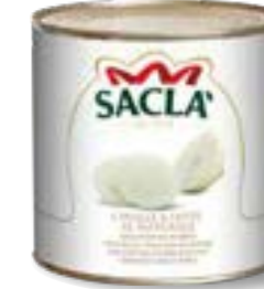
CIPOLLE BIANCHE A FETTE Sliced white onions L07413R000-006