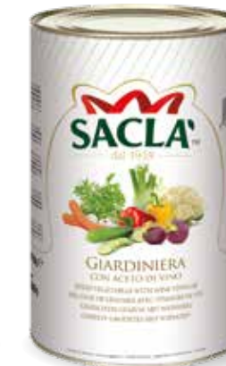
GIARDINIERA Mix of vegetables L073025000-003