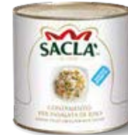
CONDIMENTO RISO Mixed vegetables for rice salad L0741G9000-006