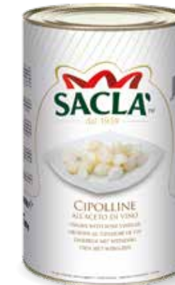
CIPOLLINE Silver skin onions L732300-003