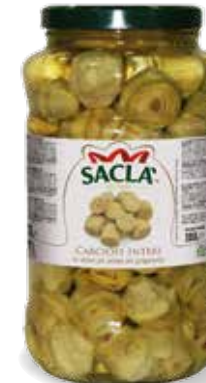
CARCIOFI INTERI Whole artichokes LCV9P00-004