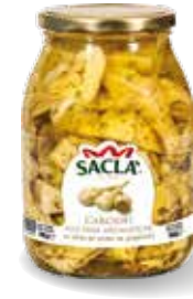
CARCIOFI TAGLIATI ALLE ERBE Seasoned artichoke quarters LCCMV00-004