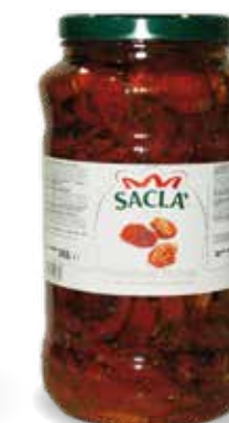
POMODORI SECCHI Sun-dried tomatoes LCVP300-004