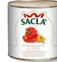
PEPERONI A FILETTI Pepper strips L074134000-006