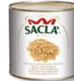
FAGIOLI CANNELLINI Cannellini beans L0740RW000-006