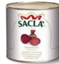
BARBABIETOLE A FETTE Sliced beetroots L74TN00-006