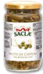
FRUTTI DI CAPPERO Caper berries L576N00-012