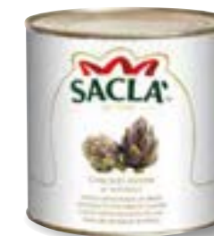
CARCIOFI INTERI Whole artichokes L74NN00-006