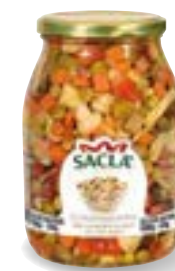
CONDIMENTO RISO Mixed vegetables for rice salad LOCCOY5000-004