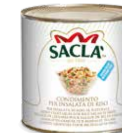
CONDIMENTO RISO Mixed vegetables for rice salad L0740Y5000-006