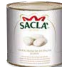
FAGIOLI BIANCHI DI SPAGNA Lima beans L0740O6000-006