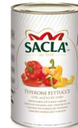
PEPERONI FETTUCCE Pepper strips L732900-003