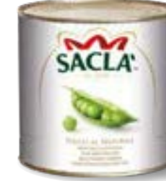
PISELLI Peas L0740N6000-006