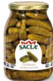
CETRIOLI Gherkins LCC2100-004