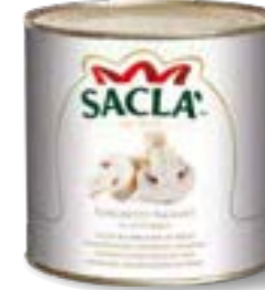
FUNGHETTI TAGLIATI Sliced mushrooms L17400N000-006