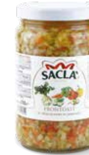
PRONTOAST Mixed vegetables L06700A000-004