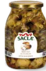
MISTO FUNGHI Mushroom salad LCCCU00-004