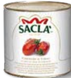
POMODORI AL FORNO Oven roasted tomatoes L747H00-006