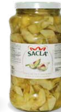
CARCIOFI A SPICCHI Artichoke quarters LCV9T00-004