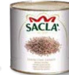
LENTICCHIE LESSATE Lentils L0741NA000-006