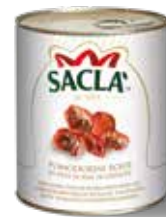
POMODORINI ROSSI SEMISECCHI Semi-dried red tomatoes LO641W8000-006