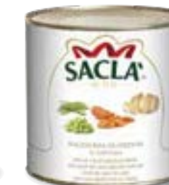
MACEDONIA DI VERDURE Mix of vegetables L0741QA000-006