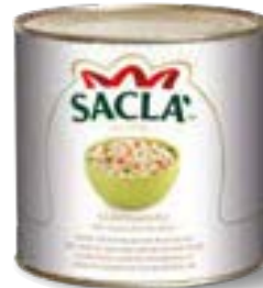
CONDIMENTO RISO Mixed vegetables for rice salad L07417R000-006