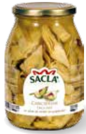
CARCIOFI TAGLIATI Artichoke quarters LCCLT00-004