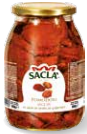
POMODORI SECCHI Sun-dried tomatoes LCCMX00-004