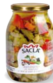
ANTIPASTO VERDURE Mixed vegetables LOCC1QE000-004