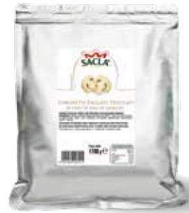
FUNGI CHAMPIGNON TRIFOLATI Seasoned Champignon mushrooms LOK11VM000-010