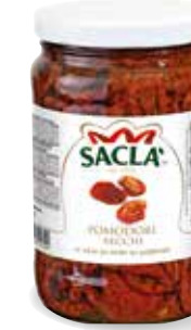
POMODORI SECCHI Sun-dried tomatoes L67MX00-004