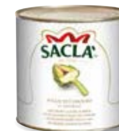
FOGLIE DI CARCIOFO Artichoke leaves L74NL00-006