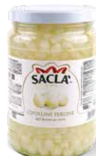
CIPOLLINE PERLINE Silverskin onions L06717V000-004