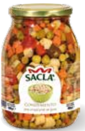
CONDIMENTO RISO Mixed vegetables for rice salad LOCCOEF000-004