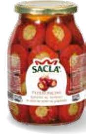
PEPERONCINI RIPIENI AL TONNO Tuna stuffed peppers LCCC500-004