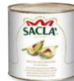
SPICCHI DI CARCIOFI Artichoke quarters L74NU00-006