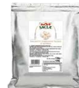
FUNGI CHAMPIGNON TAGLIATI Sliced champignon mushrooms LOK118D000-010