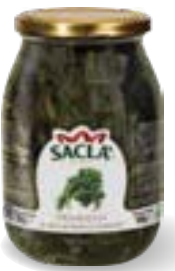
FRIARIELLI Broccoli LCCN400-004