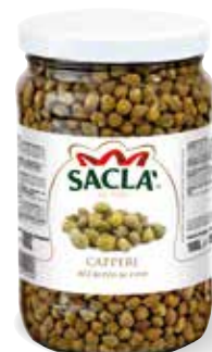
CAPPERI Capers L675300-004