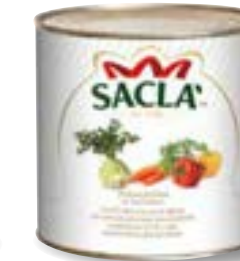
INSALATINA Vegetable salad L740F00-006