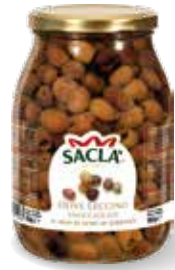
OLIVE LECCINO SNOCCIOLATE Pitted leccino olives LCCQH00-004