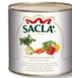
INSALATINA Mixed vegetable salad L74UH00-006