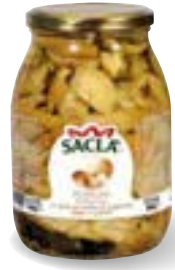
FUNGHI PORCINI Porcini mushrooms LCCR400-004