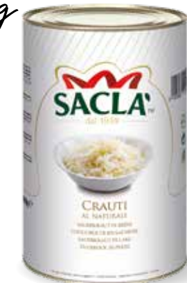
CRAUTI Sauerkraut L73UQ00-003