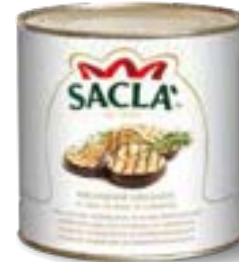
MELANZANE GRIGLIATE Char-grilled aubergines L07414S000-006