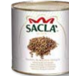
FAGIOLI BORLOTTI Borlotti Beans L0740RX000-006