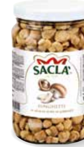
FUNGHETTI Mushrooms L67MP00-004