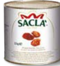
POMODORI SECCHI Sun-dried tomatoes L741RL00-006