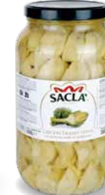
CARCIOFI TAGLIATI STIVATI Artichokes cut in pieces LOCV18B000-004