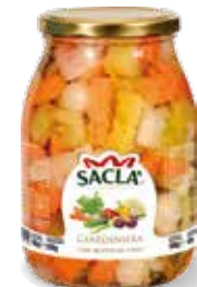
GIARDINIERA Mixed vegetables LCCMN00-004