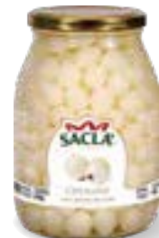
CIPOLLINE Silver skin onions LCC2300-004