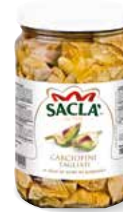
CARCIOFI TAGLIATI Artichoke quarters L67LT00-004