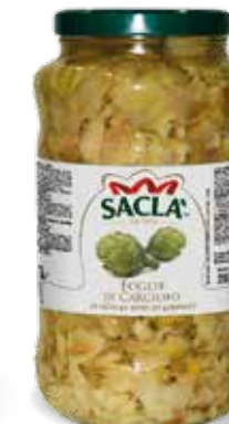
FOGLIE DI CARCIOFO Artichoke leaves LCV1HW00-004