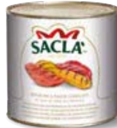
PEPERONI GRIGLIATI A FALDE Char grilled pepper halves L740X00-006