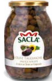
OLIVE TAGGIASCHE SNOCCIOLATE Pitted Taggiasche Olives LOCC17G000-006