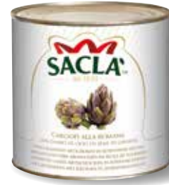
CARCIOFI CON GAMBO ALLA ROMANA Whole seasoned artichokes with stem M74XFML-006