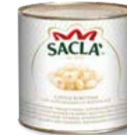
CIPOLLE BORETTANE CON ACETO BALSAMICO Borettane onions with balsamic vinegar L07417Q000-006