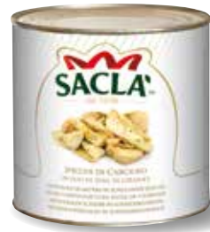
SPICCHI DI CARCIOFI Artichoke quarters L74TL00-006