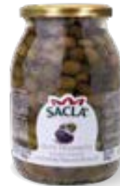
OLIVE TAGGIASCHE SNOCCIOLATE IN OLIO EXTRA VERGINE DI OLIVA Pitted Taggiasche Olives in Extra virgin Olive Oil LOCC17G000-006