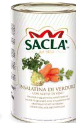
INSALATINA Vegetable salad L730R00-003