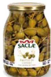
FRUTTI DI CAPPERO Caper berries LCC6N00-004