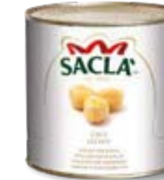
CECI Chickpeas L0740O5000-006