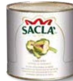
CARCIOFI A FETTINE Sliced artichokes L74NR00-006