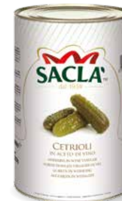
CETRIOLI Gherkins L732100-003